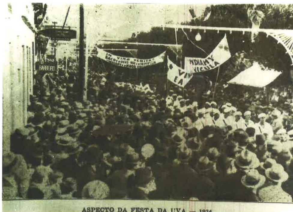
ASPECTO DA FESTA DA UVA — 1934

Desfile de Rua - 1ª Festa da Uva 1934